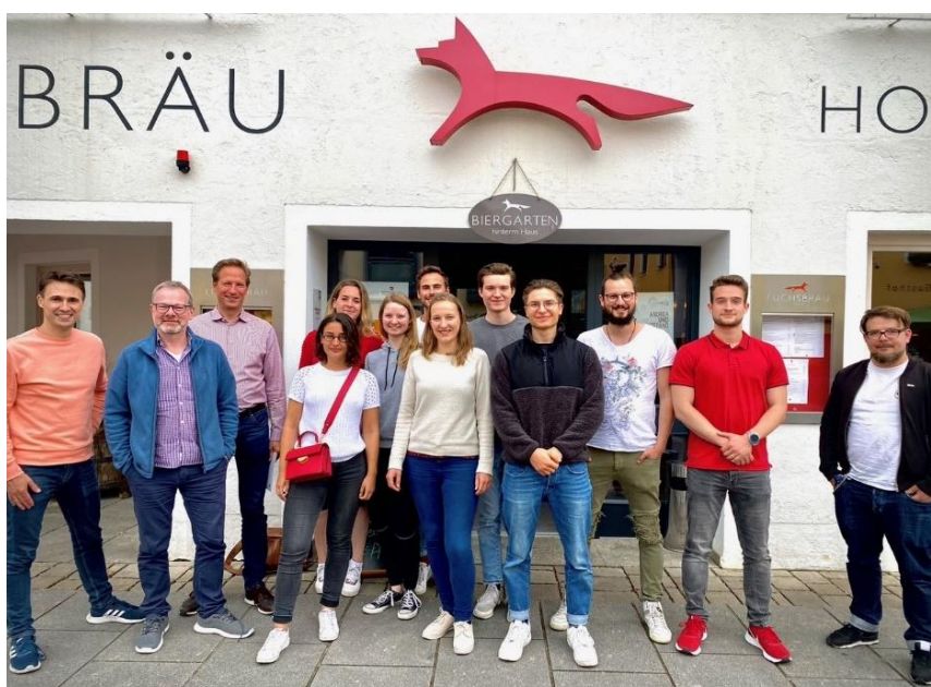
BeLA-Studierende beim Auftaktwochenende in Beilngries

(Die Namen der Studierenden im Text sind geändert)