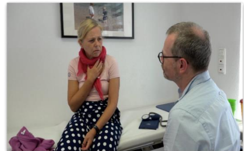
Online moodle-Kurs „Seminarvorlesung Allgemeinmedizin“, Kapitel „Erkältung“